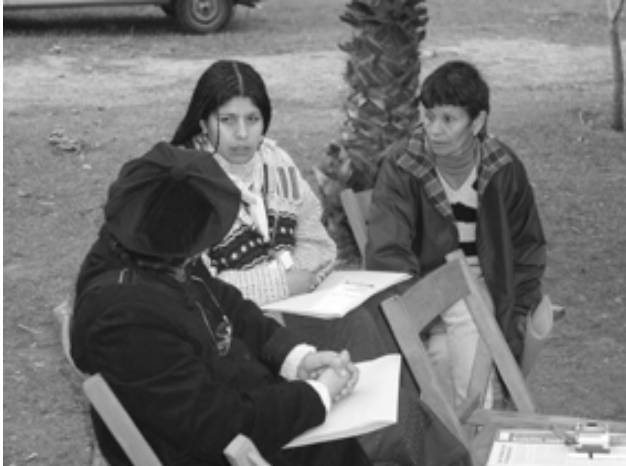
Algunas fotos del Seminario Taller